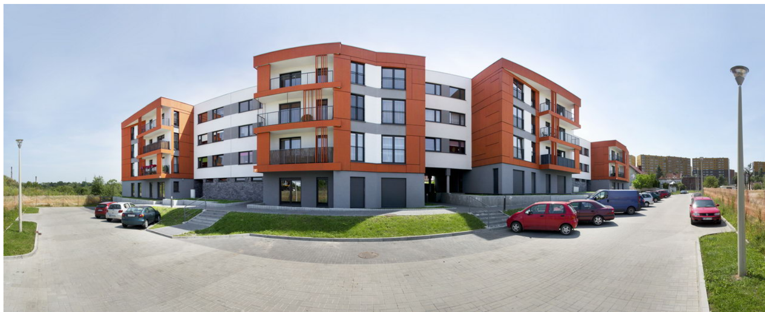
Osiedle Bursztynowe w Gliwicach