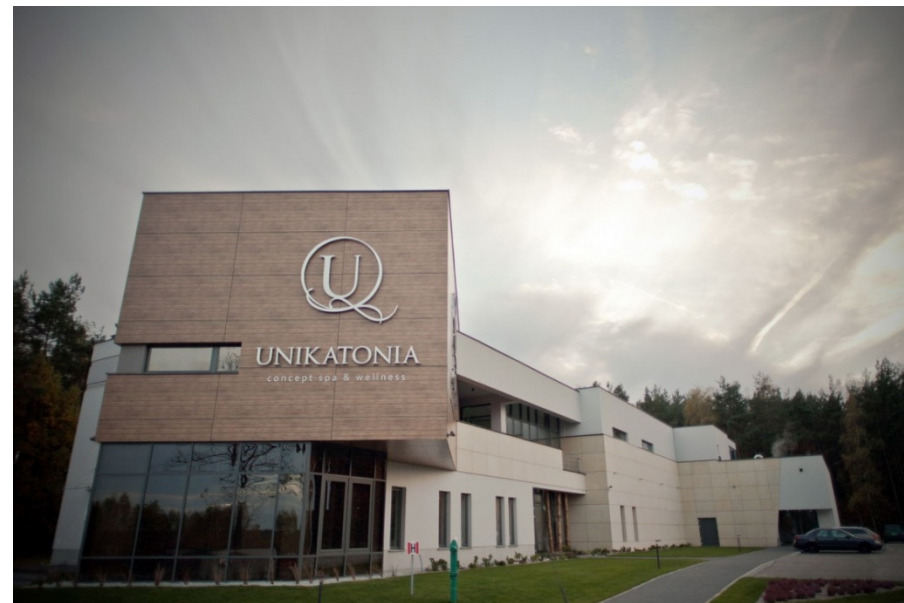
UNIKATONIA - Lubin