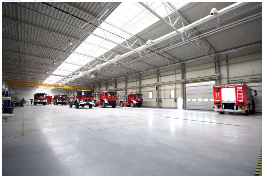
SZCZĘŚNIAK Pojazdy Specjalne - Bielsko-Biała